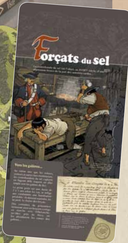
Photographies, archives, objets et illustrations se succèdent pour immerger le visiteur dans l'histoire de la contrebande locale.